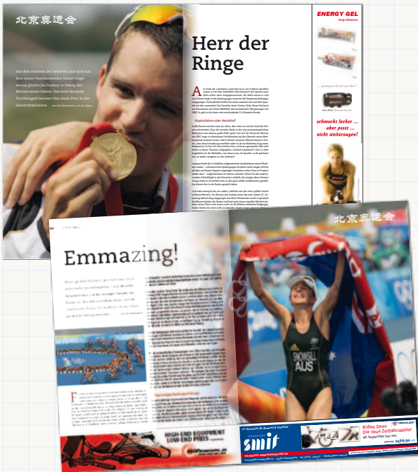
Gänsehaut im August 2008: Nach einem fulminanten Endspurt wird Jan Frodeno in Peking der erste deutsche Triathlon-Olympiasieger . Die Australierin Emma Snowsill gewinnt bei den Frauen. Ein Zeichen? Auch privat gehen die beiden später gemeinsame Wege, sind bis heute ein Paar.