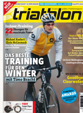
Januar 2011: Seit Ausgabe 87 erscheint triathlon im aktuellen Look.