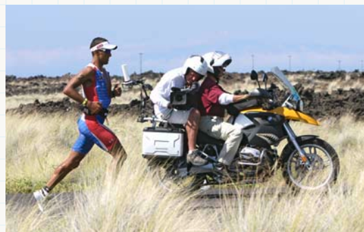
Im sechsten Anlauf gelingt Chris McCormack 2007 in Kona der ganz große Wurf: Dreieinhalb Minuten vor seinem Landsmann Craig Alexander wird er endlich Ironman-Weltmeister.