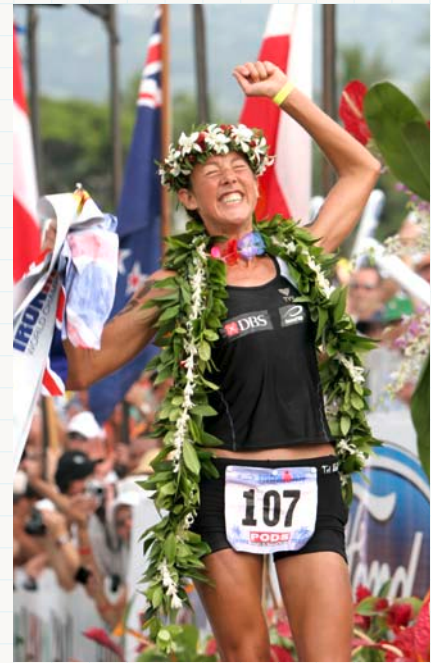
Acht Wochen nach dem Sieg bei ihrem ersten Ironman in Korea gewinnt Chrissie Wellington 2007 den Ironman Hawaii – als Rookie, erste Britin und mit mehr als fünf Minuten Vorsprung. Vor allem ihre Marathonzeit schockt die Gegnerinnen: 2:59:27 Stunden!