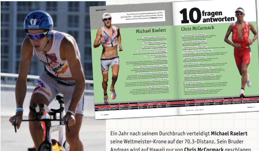
Ein Jahr nach seinem Durchbruch verteidigt Michael Raelert seine Weltmeister-Krone auf der 70.3-Distanz. Sein Bruder Andreas wird auf Hawaii nur von Chris McCormack geschlagen.