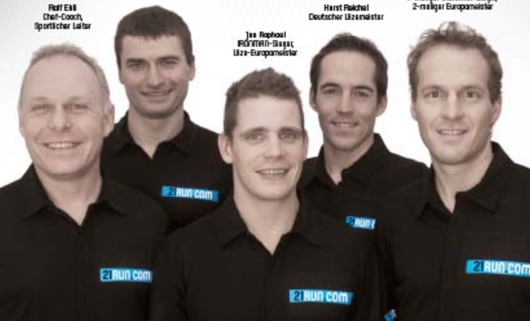
Timo Bracht 7-maliger IRONMAN-Sieger, 2-maliger Europameister

Das 21run.com Triathlon Team vertraut auf Cockpits und Laufräder von PROFILE DESIGN