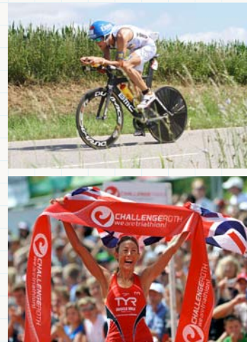
Fabelzeiten in Roth: Im Juli 2011 knackten Andreas Raelert (GER) und Chrissie Wellington (GBR) bei perfekten Bedingungen die Weltbestzeiten auf der Langdistanz (7:41:33 und 8:18:13 Std.). Wellington gewinnt später zum vierten Mal auf Hawaii.

2010 erscheint die erste Ausgabe von triathlon knowhow .